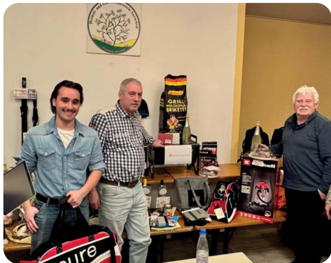
Die Gewinner des diesjährigen Muckturniers.

Im nächsten Jahr starten wir wieder mit dem Turnier.