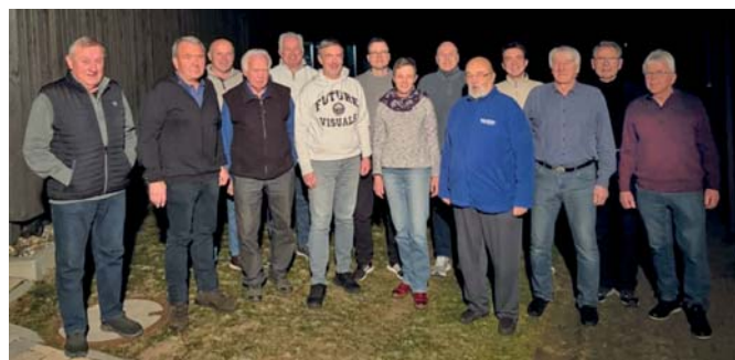
Bild: Der neu gewählte Vorstand mit allen Beisitzern und Kassenprüfern

Neu gewählt wurden unter anderem zwei Beisitzer, die frische Ideen in die Vorstandsarbeit einbringen wollen. In der Versammlung wurde zudem angeregt, künftig verstärkt Angebote für jüngere Mitglieder zu schaffen, etwa durch die Einsetzung eines Jugendleiters und neue gemeinschaftliche Aktivitäten. Diese Vorschläge sollen in den kommenden Vorstandssitzungen weiter konkretisiert werden.