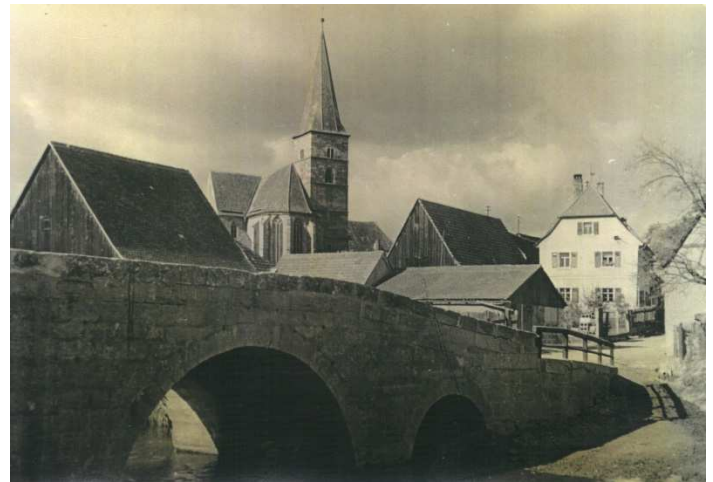
Brücke Fürther Straße